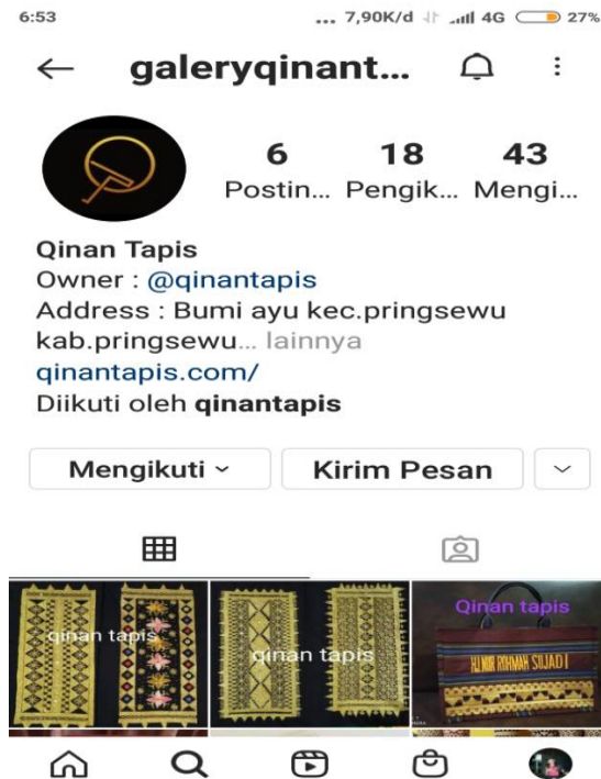
Gambar 5. Hasil Pelatihan Edit Profil Instagram