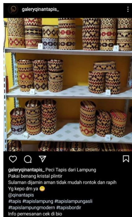
Gambar 6. Hasil Pelatihan posting promosi di Instagram