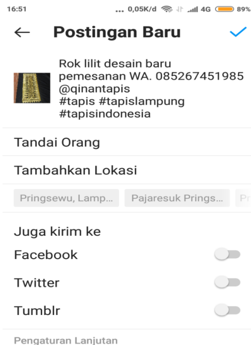
Gambar 4. Proses Promosi Melalui Postinging di Instagram

Promosi adalah suatu hal yang harus dilakukan setiap perusahaan. Hal utama dalam promosi adalah membuat pesan yang persuasive yang efektif untuk menarik perhatian konsumen (Puspitarini & Nuraeni, 2019). Pada pendampingan ini mengajarkan cara posting produk dengan menandai akun Instagram lain dan hashtag produknya agar promosi tesebar luas, karena orang calon pembeli rata-rata mencari barang menggunakan pencarian instagram yang mengisi kolomnya diawali hashtag , dan semua posting dikumpul dalam 1 galeri berdasarkan nama hashtag .