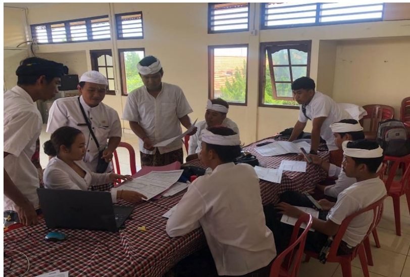
Gambar 3. Proses Pengecekan Kembali Data Penduduk di Desa Kukuh