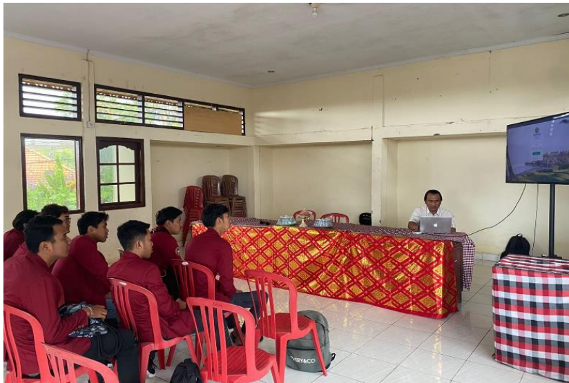
Gambar 1. Sosialisasi dan Pembagian Tugas