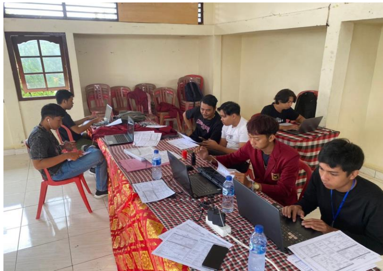
Gambar 2. Proses Kegiatan Pemutakhiran Data di Desa Kukuh