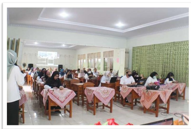
Gambar 2. Peserta Sosialisasi Mengikuti Kegiatan

Pentingnya sosialisasi dalam hal ini adalah untuk menambah wawasan dan pengetahuan bagi guru-guru dan jajarannya SMK, agar dapat memberikan informasi lanjut kepada siswa/i nya, hingga penerapan kurikulumnya. Dalam hal program SMK PK, maka diperlukan kegiatan yang rutin untuk mengembangkan materi kurikulum yang sesuai dengan ketentuan Kementerian Pendidikan. Siswa/i yang mengikuti kegiatan SMK PK, akan memiliki komunikasi Pendidikan yang sesuai dengan kurikulum yang sudah disusun. Luaran yang akan dicapai adalah manfaat pengetahuan yang mudah diterapkan. Dalam hal ini, perlu diketahui, bahwa Program SMK Pusat Keunggulan bertujuan untuk: