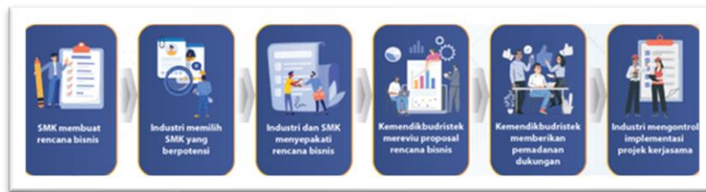
Gambar 5. Roadmap Pelaksanaan Kegiatan

Dalam tahap pengenalan login ini, maka akan ditemukan kemudahan untuk menyampaikan sosialisasi yang berkaitan dengan integrasi SMK PK. Segala pelaksanaan kegiatan akan mendapatkan materi dan pembaharuan kurikulum yang disesuaikan oleh peraturan Kementerian Pendidikan. Dari hal rencana SMK membuat tahapan bisnis atau hasil karya industri, industri memilih SMK yang berpotensi, regulasi antara mitra dan SMK PK, sampai memberikan materi padanan sebagai integrasi kurikulum. Dan memberikan pelatihan kepada kepala sekolah yang akan dilakukan mulai dari pembelajaran paradigma baru, penggunaan platform teknologi dan perencanaan berbasis refleksi diri sekolah, hingga pendampingan. Hal tersebut guna memastikan kepala sekolah agar dapat memimpin perubahan di sekolah, memiliki kemampuan dalam mengelola kerja sama dengan DUDI, serta mengembangkan dan mengelola roadmap pengembangan SMK PK.