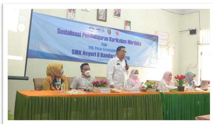
Gambar 1. Pemaparan Sosialisasi Perihal Pembelajaran Merdeka

Program SMK Pusat Keunggulan merupakan program pengembangan SMK dengan kompetensi keahlian tertentu dalam peningkatan kualitas dan kinerja, yang diperkuat melalui kemitraan dan penyelaras dengan dunia usaha, dunia industri, dunia kerja, yang akhirnya menjadi SMK rujukan yang dapat berfungsi sebagai sekolah penggerak dan pusat peningkatan kualitas dan kinerja SMK lainnya. Selain itu, ada program pendampingan yang dirancang untuk membantu SMK PK dalam pencapaian output. Pelaksana pendampingan dilakukan oleh perguruan tinggi yang telah memenuhi kriteria.