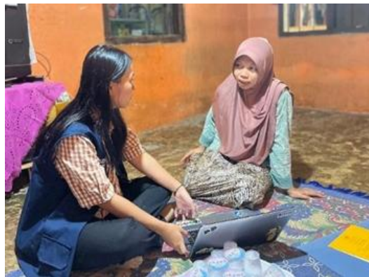
Gambar 2. Pelatihan Penyusunan Pembukuan Sederhana dan Penggunaan Microsoft Excel

Kegiatan pelatihan bertujuan untuk meningkatkan kemampuan pemilik usaha dalam melakukan pencatatan keuangan secara rapi, terstruktur, dan sistematis. Selain itu, pelatihan ini juga bertujuan agar pemilik usaha mampu mengoperasikan Microsoft Excel sebagai alat bantu dalam pengelolaan keuangan.