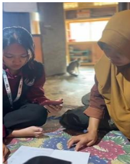
Gambar 3. Pendampingan Penyusunan Pembukuan Sederhana Berbasis Microsoft Excel

Setelah pelatihan, dilakukan kegiatan pendampingan penyusunan pembukuan sederhana berbasis Microsoft Excel. Pendampingan dilakukan dengan menggunakan data transaksi nyata yang terjadi di lapangan. Pemilik UMKM dibimbing untuk mencatat setiap transaksi, mulai dari proses produksi hingga penjualan, termasuk penerimaan dan pengeluaran kas.