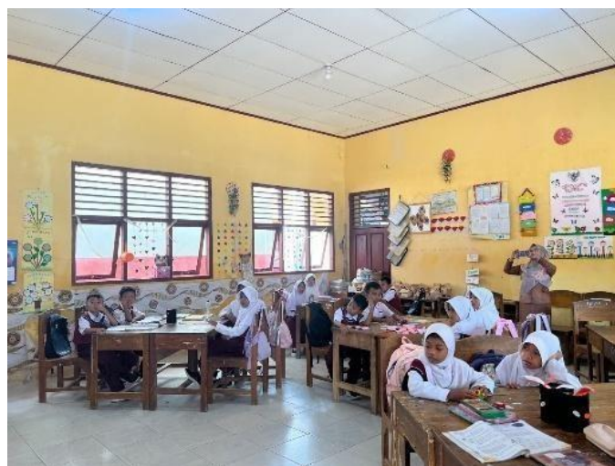
Gambar 5 Perkenalan ke Siswa/i SD Negeri 1 Kota Guring