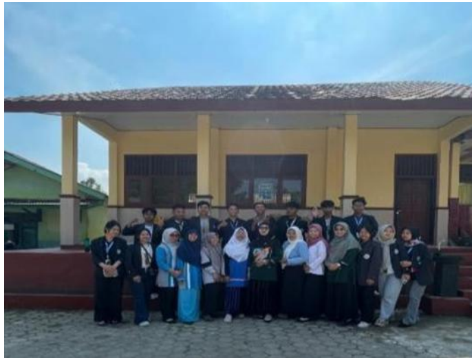
Gambar 6 Mengikuti Kegiatan Hari Anak bersama Guru SD Negeri 1 Kota Guring