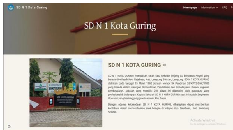
Gambar 1 Halaman Beranda Website