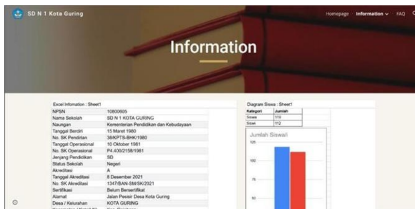
Gambar 2 Halaman Information