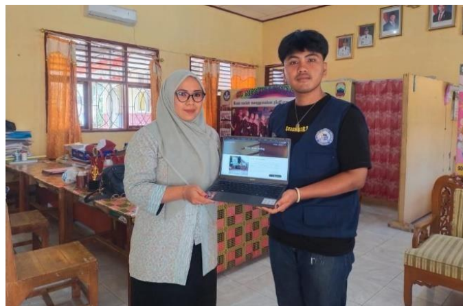
Gambar 4 Penyerahan Website Kepada Operator Sekolah

Berikut dokumentasi terkait kegiatan pengabdian masyarakat di SD Negeri 1 Kota Guring: